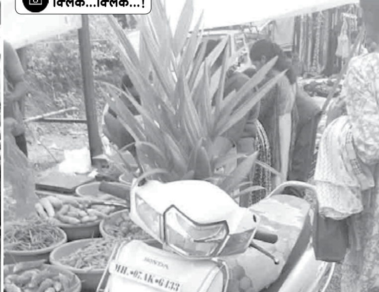
सिंधुदुर्ग : पावसाळा सुरू झाला की आठवडा बाजारातून लोक झाडांची कलमे, रोपे लागवडीसाठी घेऊन जातात.