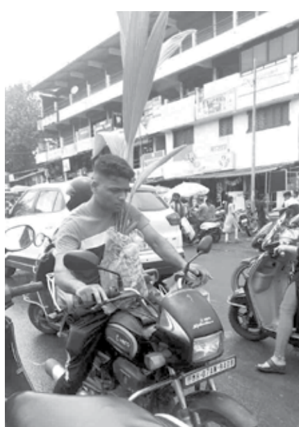
सिंधुदुर्ग : पावसाळा सुरू झाला की आठवडा बाजारातून लोक झाडांची कलमे, रोपे लागवडीसाठी घेऊन जातात.

वायरलेस चार्जिंग कित्येक गोष्टीत सोयीस्कर वाटत असले तरीही काही रिपोर्ट्समध्ये एक्सपर्टने सांगितले आहे की, फोन चार्ज करण्याची ही योग्य पद्धत नाही. यामुळे फोन लवकर गरम होतो आणि कित्येक फोन जास्त हीट सहन करू शकत नाही आणि लवकर खराब होऊ शकतात. त्यामुळे फोन जास्त हायलेट नसेल तर त्यासाठी हा चार्जर जास्त चांगली कामगिरी करू शकत नाही असे मानले जाते. तसेच जेव्हा वायरलेस चार्जिंग केली जाते तेव्हा फोन पुन्हा पुन्हा चार्जिंगबरोबर डिसकनेक्ट होतो तेव्हा जो फोनसाठी चांगले मानले जात नाही.