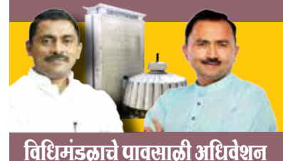
विधिमंडळाचे पावसाळी अधिवेशन