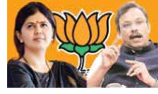
कार्यकारिणीत फेरबदल करण्यात आले आहेत.

आगामी लोकसभा निवडणुकीसाठी भाजपने कंबर कसली आहे. भाजप राष्ट्रीय अध्यक्ष जेपी नड्डा यांनी शनिवारी (दि. २९) पक्षाच्या केंद्रीय पदाधिकाऱ्यांची घोषणा केली असून यामध्ये १३ उपाध्यक्ष, आठ सरचिटणीस आणि १२ सचिवांचा समावेश आहे.