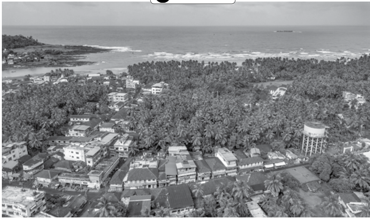
मुरुड : समुद्रकिनारी नारळ, सुपारीच्या गर्द झाडीत वसलेले मुरुड शहर आकाशातून टिपले आहे.