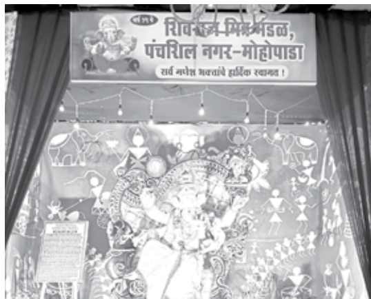
सार्वजनिक शिवराज मित्र मंडळ, मोहोपाडा पंचशिलनगर