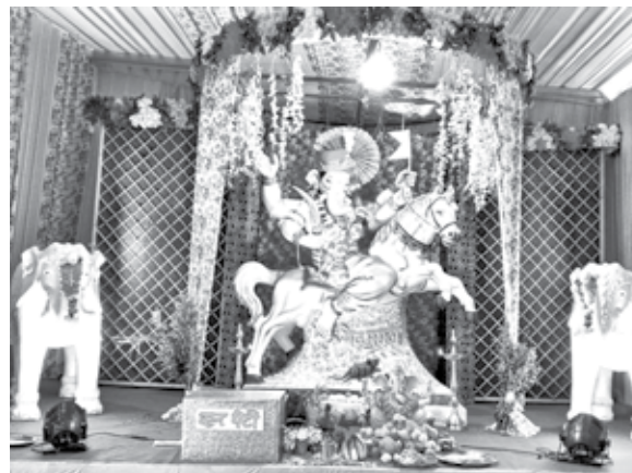
सार्वजनिक आदर्श मित्र मंडळ, मोहोपाडा पंचशिलनगर