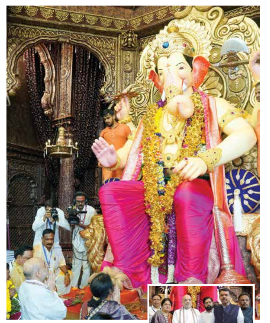
मुंबई : केंद्रीय गृहमंत्री अमित शाह यांनी लालबागच्या राजाचे सपत्नीक दर्शन घेतले. सोबत मुख्यमंत्री एकनाथ शिंदे, उपमुख्यमंत्री देवेंद्र फडणवीस, भाजप नेते आमदार आशिष शेलार, विनोद तावडे.

नागपूरमधील अतिवृष्टी आणि महापुराचा उपमुख्यमंत्री देवेंद्र फडणवीस यांनी सविस्तर आढावा घेत प्रसारमाध्यमांना माहिती दिली. ते म्हणाले, नागपूरमध्ये जवळपास चार तासांमध्ये १०९ मिलीमीटर एवढा प्रचंड पाऊस झाला. त्यामुळे अंबाझरी तलाव भरून पाणी वाहिले. हे अतिरिक्त पाणी नाग नदीतून वाहते. त्यामुळे नाग नदीला मोठा पूर आल्याची स्थिती निर्माण झाली. जवळपास ४०० नागरिकांना पाण्यातून बाहेर काढण्यात आले आहे. त्यांच्यासाठी तात्पुरत्या स्वरूपाची व्यवस्थाही करण्यात आली आहे. आता पाणी हळूहळू ओसरत आहे, मात्र अद्यापही बऱ्याच भागांमध्ये पाणी पहायला मिळत आहे. नागरिकांनी अफवांवर विश्वास ठेवू नये. प्रशासन पूर्णपणे जागरूक आहे. कुठलीही अडचण असेल, तर त्यांनी प्रशासनाशी संपर्क साधावा, असे आवाहनही उपमुख्यमंत्री फडणवीस यांनी केले आहे.