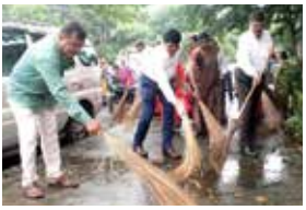
सहभाग घेतला. या अभियान अंतर्गत नवी मुंबई महापालिकेच्या माध्यमातून

शिरवणे विद्यालय आणि ज्युनिअर कॉलेज, नेरूळ सेक्टर २, नवरात्र उत्सव चौक, सेक्टर २३ जुईनगर आणि लोकनेते दि बा पाटील क्रिडा संकुल, जुईनगर विभागातील नागरिकांनी प्रतिसाद देत एक तारीख, एक दिवस स्वच्छतेसाठी या अभियानात