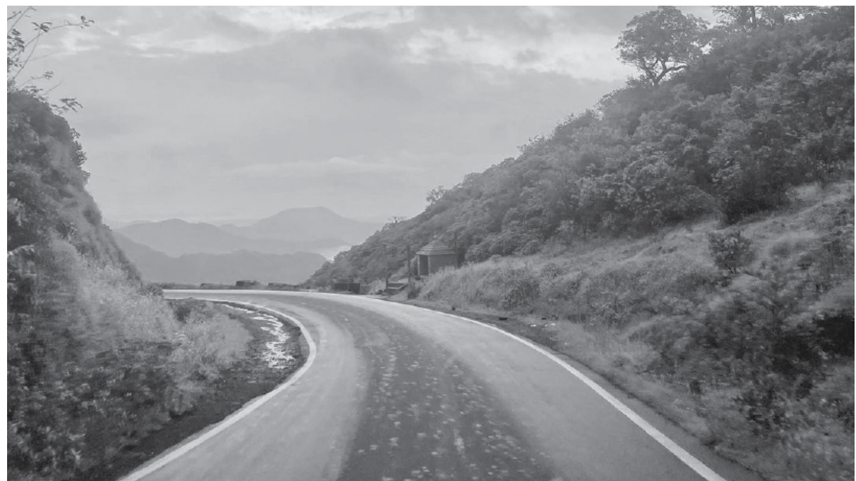
कोल्हापूर : पावसाळा संपत आला असला तरी याआधी पाऊस पडून गेला असल्याने रस्त्याच्या दुतर्फा निसर्गसंपदा दिसून येते.