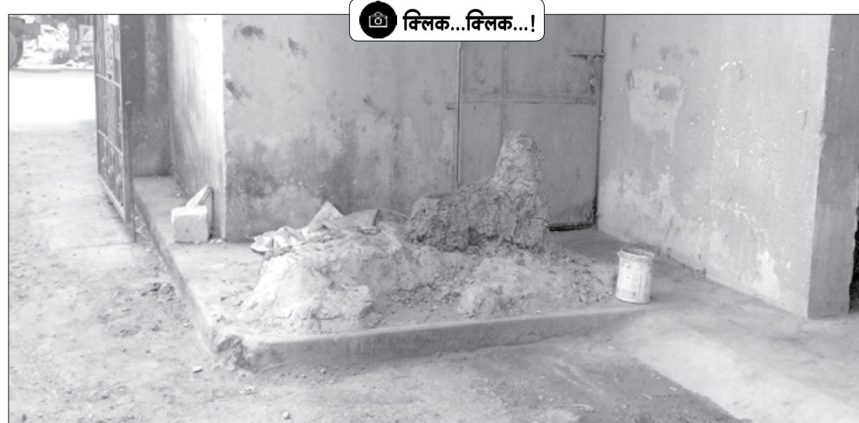
पनवेल : दिवाळी जवळ येत असल्याने किल्ल्याची लगबग आता जोर धरू लागली आहे. मार्केट यार्ड परिसरातील एएमएस हेरिटेज हौसिंग सोसायटीमध्ये बंधूकंपनीने किल्ला बनविण्यास सुरुवात केली आहे.