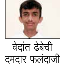
वेदांत देबेची दमदार फलंदाजी

आणि चौथ्या सामन्यात सेंट मेरी स्कूल उरणचा पराभव केला. यानंतर अंतिम सामन्यात जनता विद्यालय खोपोली संघाला मात देत विजेतेपदावर मोहर उमटवली