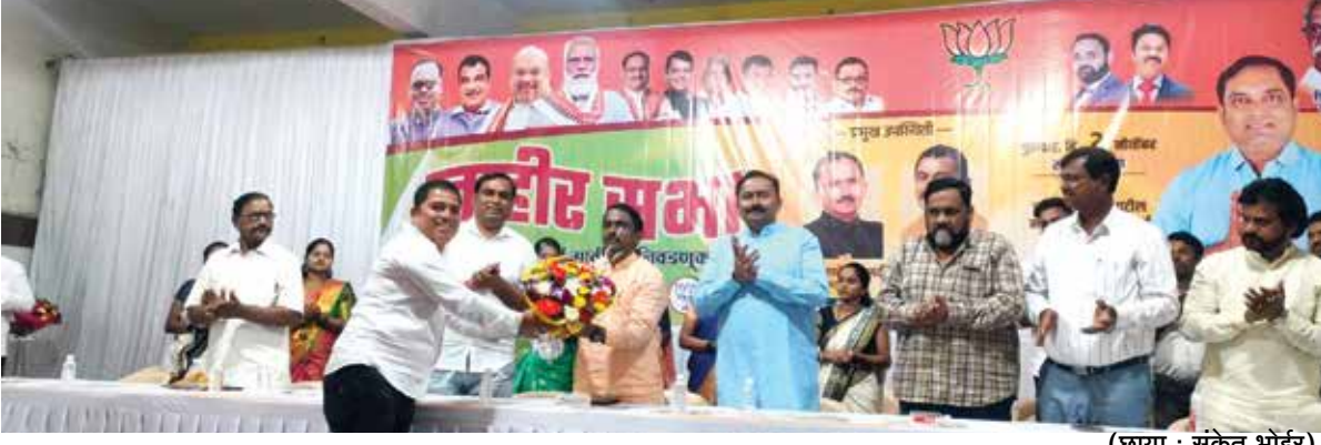
पनवेल : रामप्रहर वृत्त