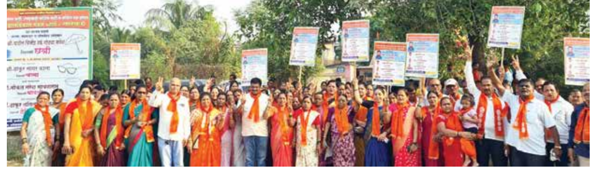
पनवेल : रामप्रहर वृत्त

पनवेल तालुक्यामध्ये ग्रामपंचायत निवडणुकांची धामधूम सुरू आहे. त्या अंतर्गत न्हावे ग्रामपंचायतीमधील प्रचार अंतिम टप्प्यात आला आहे. त्यानुसार भारतीय जनता पक्ष, राष्ट्रवादी काँग्रेस पक्ष आणि काँग्रेसप्रणित उत्कर्ष ग्रामविकास मंडळ न्हावे-न्हावेखाडीच्या उमेदवारांच्या प्रचारार्थ शुक्रवारी (दि. ३) प्रचार रॅलीचे आयोजन करण्यात आले होते.