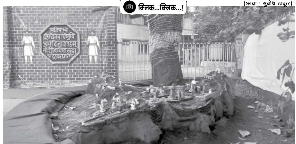
पानवेल : दिवाळीनिमित्त शहरातील मिडलक्लास हौसिंग सोसायटी मैदानावर किल्ले रायगडची प्रतिकृती साकारण्यात आली आहे.