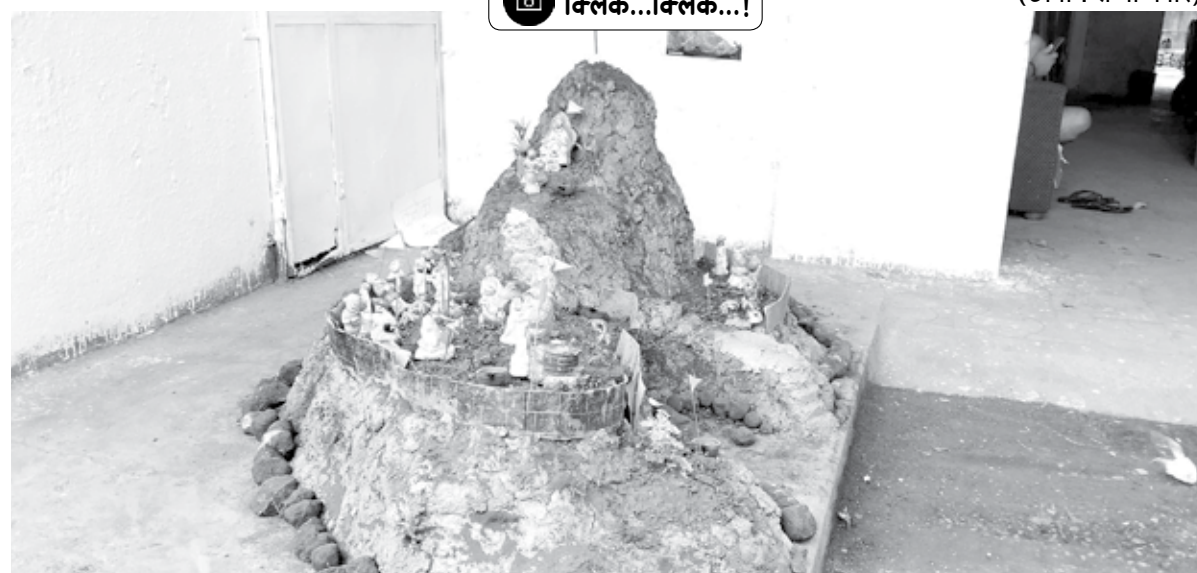
पनवेल : दिवाळीनिमित्त माकेट यार्ड परिसरात असणाऱ्या एएमएस सोसायटीमधील बबेकेपनीने कर्नाळा किल्ल्याची प्रतिकृती साकारली आहे.