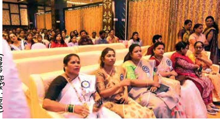
(छाया : अक्षय शारदेल)