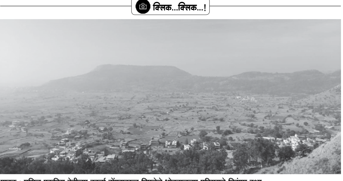
मावळ : प्रसिद्ध एकविरा देवीच्या कार्ना डोंगरावरून टिपलेले भोवतालच्या परिसराचे विहंगम दृश्य.