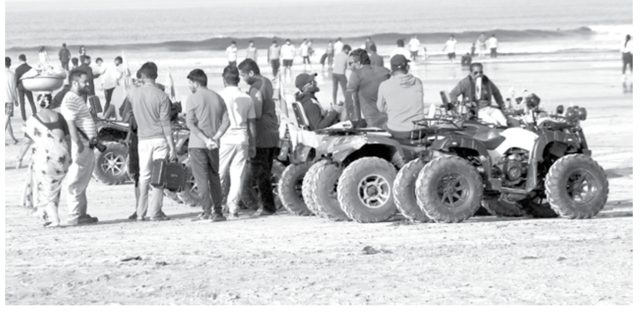
श्रीवर्धन : सरत्या वर्षाला निरोप देण्यासाठी दिवेआगर समुद्रकिनार्यावर पर्यटकांनी मोठी गर्दी केली होती. अनेक पर्यटक किनाऱ्यावरील विविध राईड्सचा मनमुराद आनंद लुटताना दिसून आले.