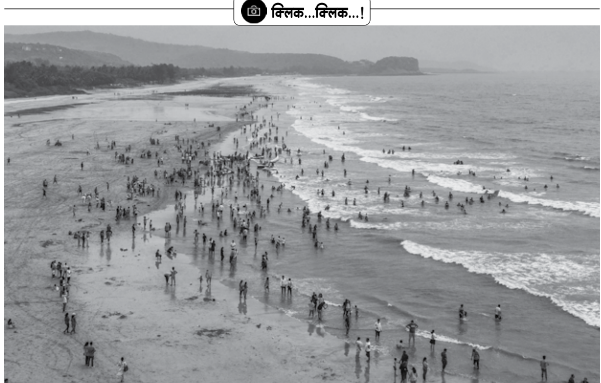
मुरुड : गेल्या आठवड्यात आलेल्या सलग सुट्ट्यांमध्ये प्रसिद्ध काशिद समुद्रकिनारी पर्यटकांनी गर्दी केली होती.

थंडीच्या काळात आहारात बदल होतो, त्यामुळे बद्धकोष्ठता, गॅस, अपचन, बद्धकोष्ठता अशा समस्यांनी लोक हाराण झाल्याचे पाहायला मिळत आहे. अशा परिस्थितीत आल्याचे सेवन केल्यास या समस्यांपासून सुटका मिळू शकते.