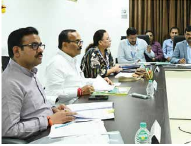
राज्य सरकारकडून निधीला मंजूरी

या मंजूरीनंतर ओबीसी विभागाचे २०२३-२४च्या योजनांसाठी तरतूद ७,८७३ कोटी इतकी झाली आहे. ओबीसी विभाग स्थापन झाल्यानंतर एका वर्षासाठी झालेली ही विक्रमी