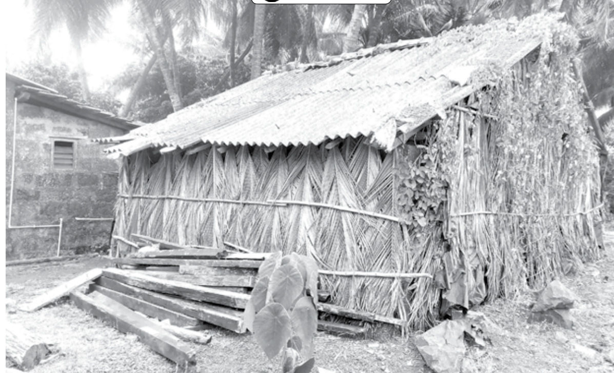
रत्नागिरी : कोकणात नारळाची झाडे भरपूर असल्याने येथील जुन्या घरांना झावळ्या लावलेल्या पहावयास मिळतात.