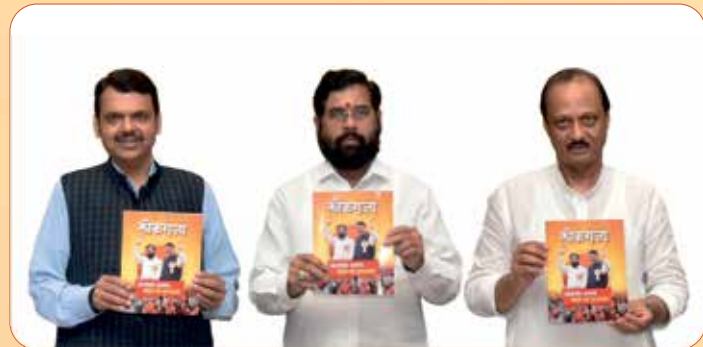
देवेद फडणवीस उपमुख्यमंत्री