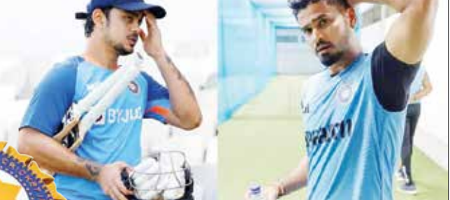
व्यक्त केले होते. यावर जय शाह म्हणाले की, खरतर बीसीसीआयच्या निर्देशानंतरही इशान आणि अय्यरला देशांतर्गत स्पर्धा न खेळण्याबद्दल करारातून बाहेर ठेवण्यात आले होते. गेल्या वर्षीच्या एकदिवसीय विश्वचषकानंतर इशानने दीर्घ

नवी दिल्ली : वृत्तसंस्था भारतीय क्रिकेट नियामक मंडळाचे (बीसीसीआय) सचिव जय शाह यांनी एक मोठा खुलासा केला आहे. इशान किशन आणि श्रेयस अय्यर यांना बीसीसीआयच्या वार्षिक करारातून वगळण्याचा निर्णय पूर्णपणे मुख्य निवडकर्ता प्रमुख अजित आगरकर यांचा होता, असे शाह यांचे म्हणणे आहे. इशान किशन आणि श्रेयस अय्यर यांना बीसीसीआयने या वर्षी जारी केलेल्या वार्षिक करारात स्थान मिळाले नाही. त्यानंतर अनेक दिग्गजांनीही बोर्डाच्या या निर्णयावर आपले मत व्यक्त केले होते. यावर जय शाह म्हणाले की, खरतर बीसीसीआयच्या निर्देशानंतरही इशान आणि अय्यरला देशांतर्गत स्पर्धा न खेळण्याबद्दल करारातून बाहेर ठेवण्यात आले होते. गेल्या वर्षीच्या एकदिवसीय विश्वचषकानंतर इशानने दीर्घ