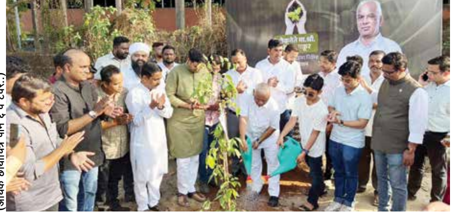
(अधिक छायाचित्रे पान ६ व ७ वर.)