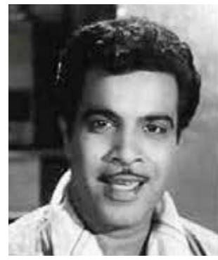
रात्री अशा', 'एक गाव बारा भानगडी', 'मुंबईचा जावई',