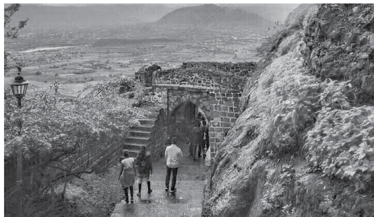
जुन्नर : छत्रपती शिवाजी महाराजांचे जन्मस्थान शिवनेरी किल्ल्याचे पावसाळ्यातील मनमोहक दृश्य.

ऑफर मॅकबुक एअर, मॅकबुक प्रो, आयमॅक, मॅक मिनी, आयपॅड एअर व आयपॅड प्रो यांसह अॅपल उत्पादनांवर लागू होते. अॅपल पेन्सिल प्रो आणि मॅजिक की-बोर्डसारख्या अॅक्सेसरीज शैक्षणिक किमतीतदेखील उपलब्ध आहेत. या ऑफरचा लाभ घेण्यासाठी कॉलेजेचे विद्यार्थी, शिक्षक आणि कर्मचारी हे UNIDAYSद्वारे या ऑफरसाठी अर्ज करू शकतात, पण या ऑफर्सचा लाभ घेण्यासाठी तुम्हाला व्हेरिफिकेशनही करावे लागेल.