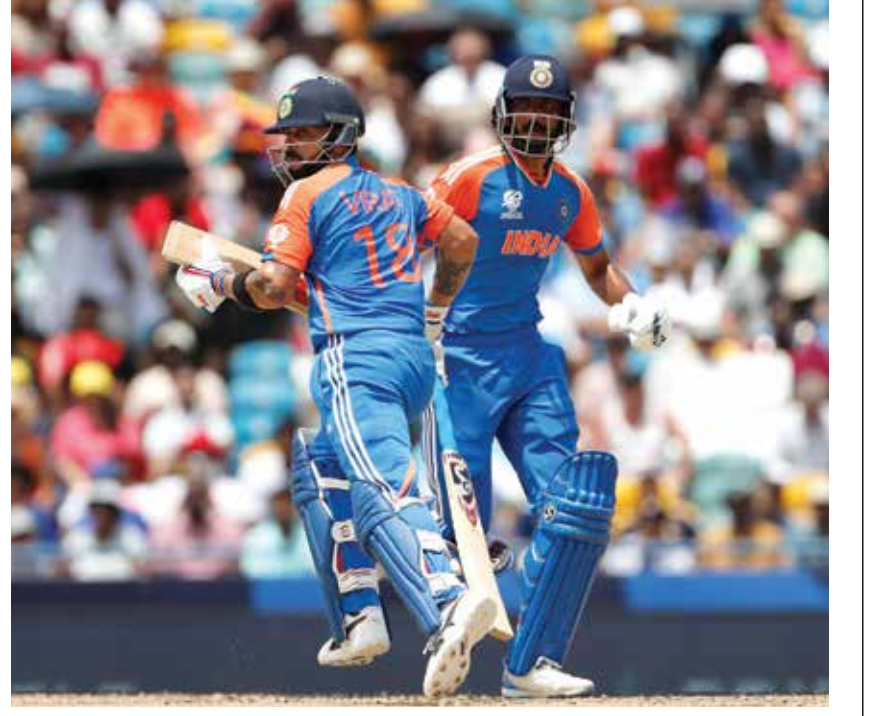
ब्रिजटाऊन : भारतीय संघाने दक्षिण आफ्रिकेविरुद्धच्या टी-२० वर्ल्डकप फायनलमध्ये प्रथम फलंदाजी करताना ७ बाद १७६ धावा केल्या. सुरुवातीच्या पडझडीनंतर विराट कोहली आणि अक्षर पटेल यांनी संघाचा डाव सावरला. यादरम्यान विराटने अर्धशतक केले.

मुख्यमंत्री तीर्थदर्शन योजना लाभ घेता येणार आहे. याचे तिकीट दर किती असणार? मोफत असणार की त्यात शुल्क माफी असणार? या योजनेंतर्गत कोणत्या देवस्थानांचा समावेश असणार? याचे नियोजन कसे होणार? यामुळे राज्याच्या तिजोरीवर किती भार पडणार? हे सर्व लवकरच स्पष्ट होणार आहे.