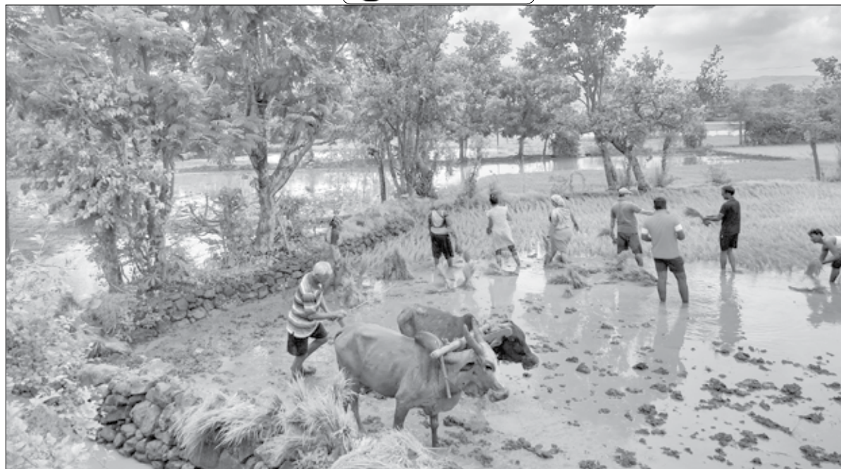
म्हसळा : पावसाळ्यात कोकणात शेतीकामे सुरू असून खरसई येथे टिपलेले हे शिवारातील छायाचित्र.