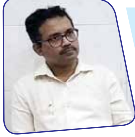
उपचारासाठी मुंबई, पुण्यात जावे लागते. यासाठी काही विशेष उपाययोजना?

► पूर्वी रुग्णालयात येण्यास ग्रामीण भागातील लोकांना भीती वाटत होती. यासाठी रुग्णालयांमध्ये आनंदी वातावरण असावे, सर्व रुग्णालयांमध्ये स्वच्छता राखण्याच्या सूचना दिल्या. ग्रामीण भागातील रुग्णालये सुस्थितीत आणली. बालमृत्यू कमी करण्यासाठी प्रयत्न केले. श्रीवर्धन, माणगाव डायलेसीस केंद्र सुरु