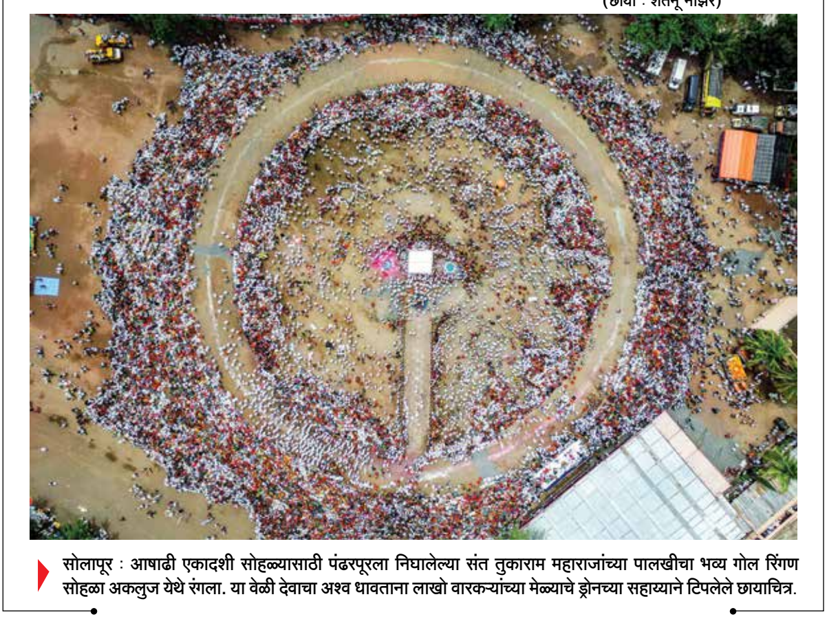
सोलापूर : आषाढी एकादशी सोहळ्यासाठी पंढरपूरला निघालेल्या संत तुकाराम महाराजांच्या पालखीचा भव्य गोल रिंगण सोहळा अकलुज येथे रंगला. या वेळी देवाचा अश्व धावताना लाखो वारकऱ्यांच्या मेळ्याचे झेनच्या सहाय्याने टिपलेले छायाचित्र.

अतिवृष्टी होत असून सकाळी रायगड किल्ल्यावर महादरवाजाच्या खाली असलेल्या सपाट पाय मार्गावर दरड कोसळली. गडावरील भले मोठे दगड खाली आल्याने पायवाटेवर बांधलेले संरक्षक कटडे काही ठिकाणी तुटले आहेत. प्रशासनाने पायरी मार्ग बंद करण्याचा निर्णय घेतल्याने या ठिकाणी अनर्थ टळला. महसूल विभागकडून या घटनेची नोंद घेण्यात आली आहे.