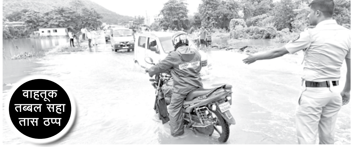
वाहतूक तब्बल सहा तास ठप्प

रस्ता रुंदीकरण व पुलांमुळे पावसाळ्यात हा मार्ग सोयीचा होईल, अशी अपेक्षा होती, मात्र सर्वेचे हाल झाले आहेत. पुलाच्या दोन्ही बाजूला रस्त्यावर पाणी साचून वाहतूक कोंडी झाल्यामुळे नागरिक हॅराण झाले.