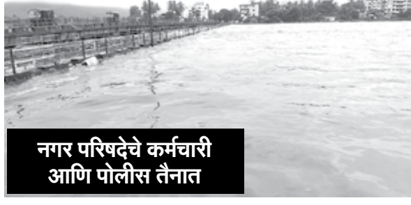
नगर परिषदेचे कर्मचारी आणि पोलीस तैनात

अष्टमी नाक्यावर पाणी; 'कुंडलिके'ने ओलांडली इशारा पातळी