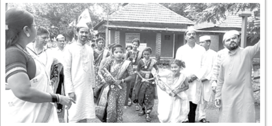
पनवेल : आषाढी एकादशीनिमित्त तालुक्यातील तारा येथील बानू बँन प्रवीण शहा माध्यमिक विद्यालय आणि जुनिअर कॉलेजच्या वतीने मंगळवारी शाळेमध्ये दिंडीचे आयोजन करण्यात आले होते. या वेळी लेझमी, फुगडी, रिगण असे अनेक उपक्रम राबविण्यात आले. विद्यार्थी आणि शिक्षकांनी विदूनामाचा जयघोष करीत गावात दिंडी मिरवणूक काढली. बानू बँन प्रवीण शहा विद्यालयामध्ये पहिल्यांदाच या दिंडीचे आयोजन करण्यात आले होते. या मिरवणुकीला विद्यार्थी, शिक्षक, कर्मचारी आणि ग्रामस्थ उपस्थित होते.

हितेंद्र ठाकूर यांच्या तीन आमदारांच्या सतराशे कोटीची कामे दिली, त्यामुळे शेवटच्या क्षणी त्यांनी मला मते दिली नाहीत. विधान परिषद निवडणुकीत आमदारांची मते २५ कोटींना विकत घेतली गेली, असा गंभीर आरोप जयंत पाटील यांनी केला. ज्यांना जिल्हा मध्यवर्ती बँक असो अथवा इतर माध्यमातून करोडो रुपयांची मदत केली त्यांनी फसवल्याची खंत पाटील यांनी या वेळी व्यक्त केली.