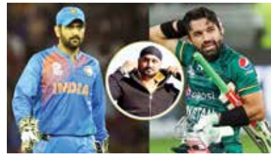
कॅप्टन कूल महेंद्रसिंह धोनीसोबत केली. ही पोस्ट पाहताच भारताचा माजी खेळाडू हरभजन सिंगने संतप्त प्रतिक्रिया दिली.

पाकिस्तानचे चाहते त्यांच्या संघातील खेळाडूंप्रमाणे कधी काय करतील याची कल्पना नसते. एखाद्या संघाने पाकिस्तानच्या तोंडचा घास पळवल्यानंतर पाकिस्तानी चाहते भ्रष्ट प्रतिक्रिया देत असतात. हा जणू काही कॉमेडी शो असतो. आता पाकिस्तानातील एका क्रीडा पत्रकाराने हदच ओलांडली. त्याने चक्र यष्टीरक्षक मोहम्मद रिझवानची तुलना भारतीय संघाचा माजी कर्णधार, दिग्गज,