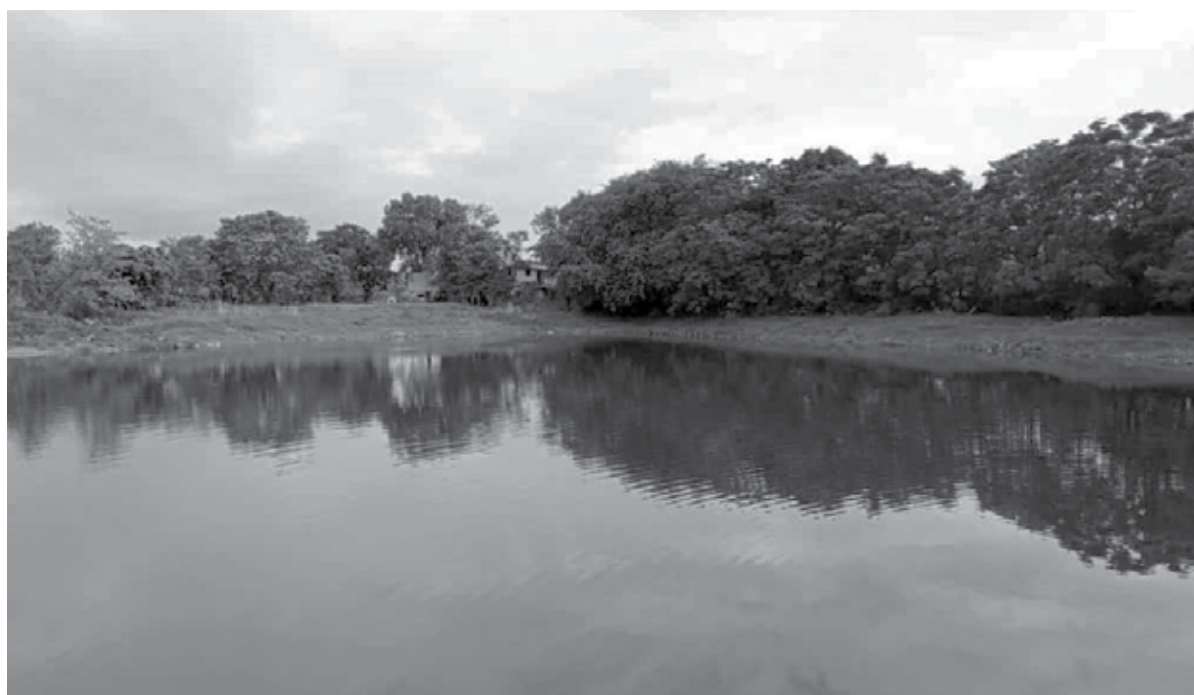
पनवले : सतत पडणाऱ्या पावसामुळे जलाशये छान भरली आहेत. हे छायाचित्र आहे आदई येथील तलावाचे.

अॅपल एअरपॉड्स हे आयफोन ७ सीरिजबरोबर सादर केलेले, जगभरातील सर्वात लोकप्रिय वायरलेस इअरफोन आहेत. गेल्या काही वर्षांमध्ये, पलने एअरपॉड्समध्ये अनेक नवीन फीचर्ससह सुधारणा केल्या गेल्या आहेत आणि नुकत्याच झालेल्या २०२४ वर्ल्डवाइड डेव्हलपर्स कॉन्फरन्स (WWDC) मध्ये नवीन कॅमेरा हार्डवेअरसह, अॅपल त्यांना व्हिजन प्रोशी सुसंगत काहीतरी नवीन घेऊन येण्याचा मार्ग कंपनी शोधत आहे.