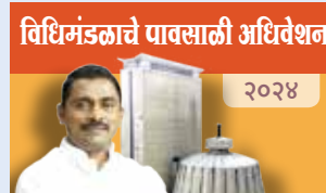
विधिमंडळाचे पावसाळी अधिवेशन २०२४

चवदार तळ्याची दुरुवस्था झाली असून त्यातील पाणी पिण्यायोग्य राहण्यासाठी आवश्यक ती देखभाल न केल्याने पाण्यावर शेवाळ साठून दुर्गंधी पसरली आहे. परिणामी पाणी प्रदूषित होऊन नागरिकांच्या आरोग्याला धोका निर्माण झाला असल्याचे निदर्शनास आले आहे. (पान २ वर...)