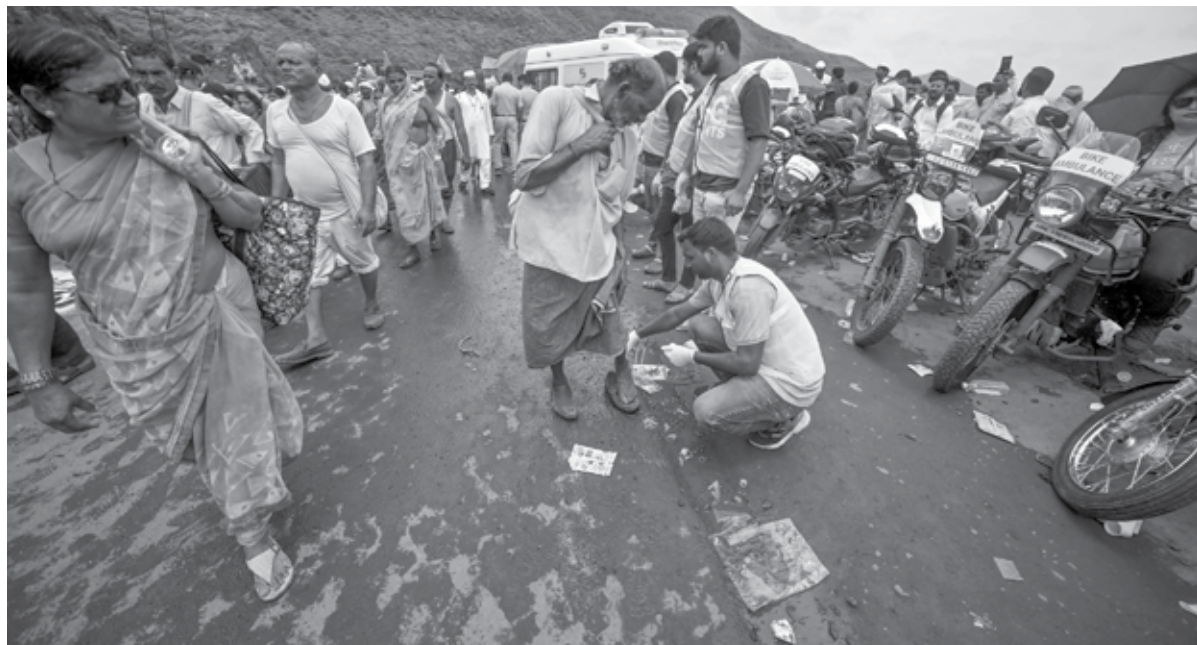
दिवे घाट : संत ज्ञानोबा माऊलींच्या पालखीदरम्यान वारकऱ्यांना वैद्यकीय सेवा देताना कर्मचारी.