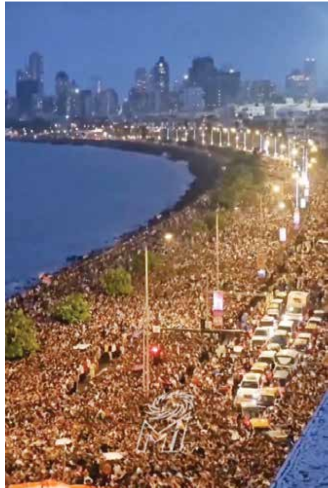
मुंबई : टी-२० विश्वचषक विजेत्या भारतीय संघाची क्रिकेटच्या पंढरीत निघालेल्या भव्य दिव्य मिरवणुकीची चित्रमय झलक.