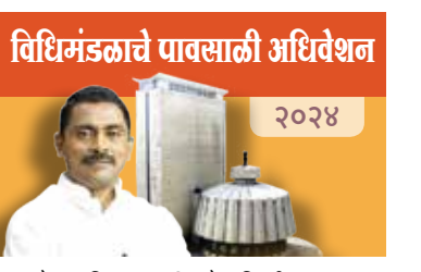
विधिमंडळाचे पावसाळी अधिवेशन २०२४

विकसकांकडे निधी उपलब्ध होत नसल्याने रखडल्याचे आढळून आले आहे. उर्वरित योजनांपैकी २२ योजना या विविध प्राधिकरणांचे ना हरकत प्रमाणपत्र प्राप्त न झाल्याने, तर २० योजना या न्यायालयीन प्रकरणांमुळे रखडलेल्या आहेत तसेच नऊ योजनांमधील विकासकांवर कलम १३(२) अंतर्गत कारवाई करण्यात आलेली आहे. झोपडपट्टी पुनर्वसन प्राधिकरणामार्फत रखडलेल्या झोपडपट्टी पुनर्वसन योजना मार्गी लावण्याकरिता शासन मान्यतेनेतर निविदा प्रक्रियेने विकसकाची नियुक्ती करणे, अभय योजना राबविणे मुंबई महानगर प्रदेशातील झोपडपट्टी पुनर्वसन योजना अन्य महामंडळे प्राधिकरणे/स्थानिक स्वराज्य संस्था मार्फत संयुक्त भागीदारी अन्वये राबविणे या तीन धोरणात्मक उपाययोजनांनुसार कार्यवाही करण्यात येत आहे.