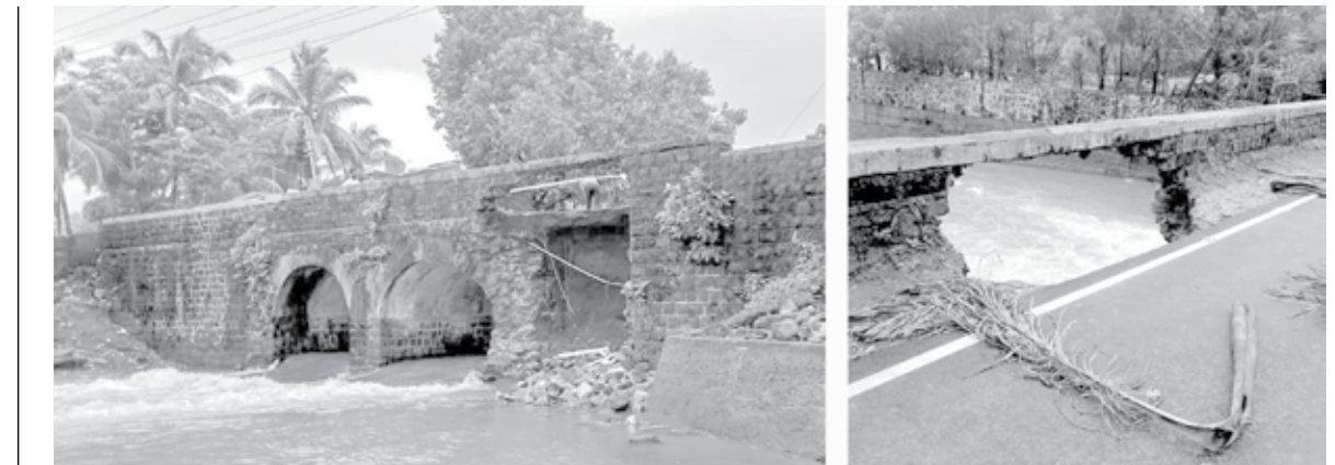
मुळुंड : पावसामुळे चिकणी गावाजवळील पूल खचल्याने या पुलावरील वाहतूक बंद करण्यात आली आहे.