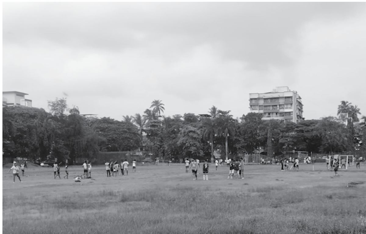
पनवेल : पावसाने सोमवारी थोडी उंसत घेतल्याने मिळालेल्या वेळेत बच्चेकंपनी मैदानावर खेळताना दिसली. (छाया : तन्वी पवार)

त्वचेसाठी फायदेशीर : भोपळ्याच्या बियांमध्ये कोलेजन असतं. कोलेजनमुळे हाडे आणखी मजबूत होतात. त्वचेचा लवचीकपणा वाढतो आणि यामुळे त्वचा आणखी तरुण आणि निरोगी दिसते.