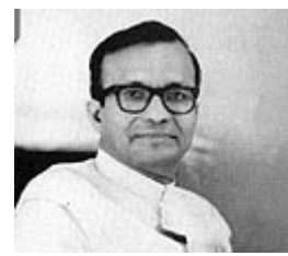
आकाशवाणीवरूनही प्रसृत करण्यात आल्या.

वर्षापासूनच त्यांनी लेखनास आरंभ केला. १९३६ मध्ये त्यांची पहिली एकांकिका 'मेरी बांसुरी' रंगभूमीवर आली आणि लगेच ती सरस्वती नियतकालिकातून प्रसिद्धही झाली. भोर का तारा (१९४६) हा त्यांचा पहिला गाजलेला एकांकिकासंग्रह. नंतर १९५६ मध्ये त्यांचा ओ मेरे सपने हा एकांकिकासंग्रह प्रसिद्ध झाला. त्यांच्या काही एकांकिका