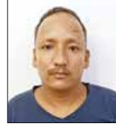
नेण्यात आले होते. याबाबतच्या तक्रारी पनवेल

येथे झालेल्या चोरीमध्ये तेथील दानपेटी फोडून अंदाजे ५० हजार रुपये रोख चोरून नेण्यात आले होते. त्याचप्रमाणे शहरातील लाईन आळी येथील सेंट फ्रान्सिस न्यू चर्म येथेही चर्मच्या पाठीमागील दरवाजा तोडून तेथील कपाटात असलेल्या दान पेटीमधील रोख रक्कम पाच हजार रुपये चोरून