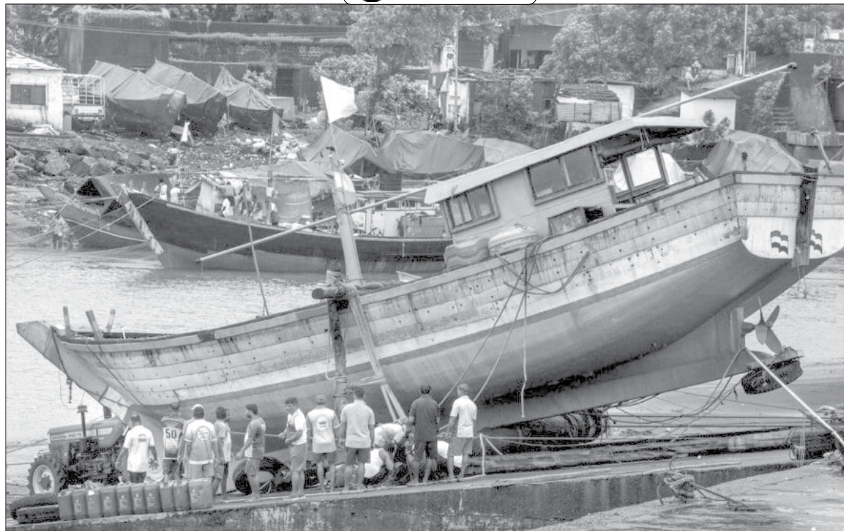
मुरुड : मासेमारी हंगाम नव्याने सुरू होताना समुद्रकिनारी शाकारलेल्या होड्या गुरवारी पुन्हा समुद्रात मार्गस्थ झाल्या.