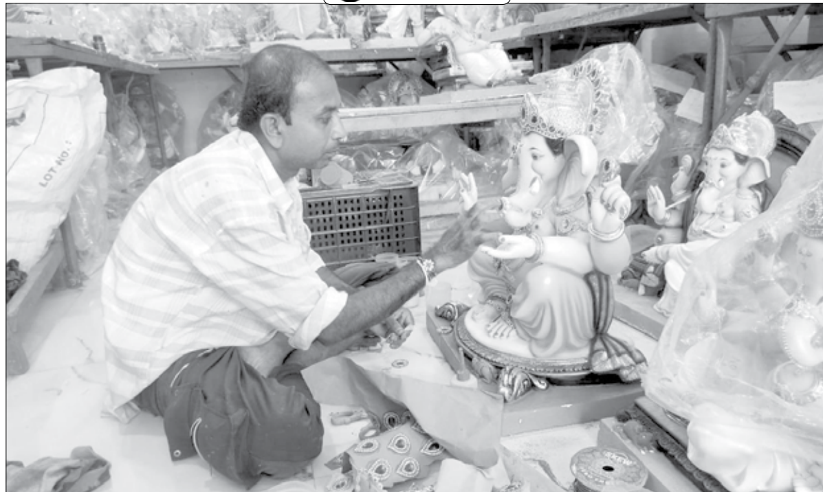
उरण : गौरी गणपतीचा सण जवळ येत आहे. त्यामुळे कारागिर गणेशमूर्तीच्या सजावटीमध्ये मग्न आहेत.