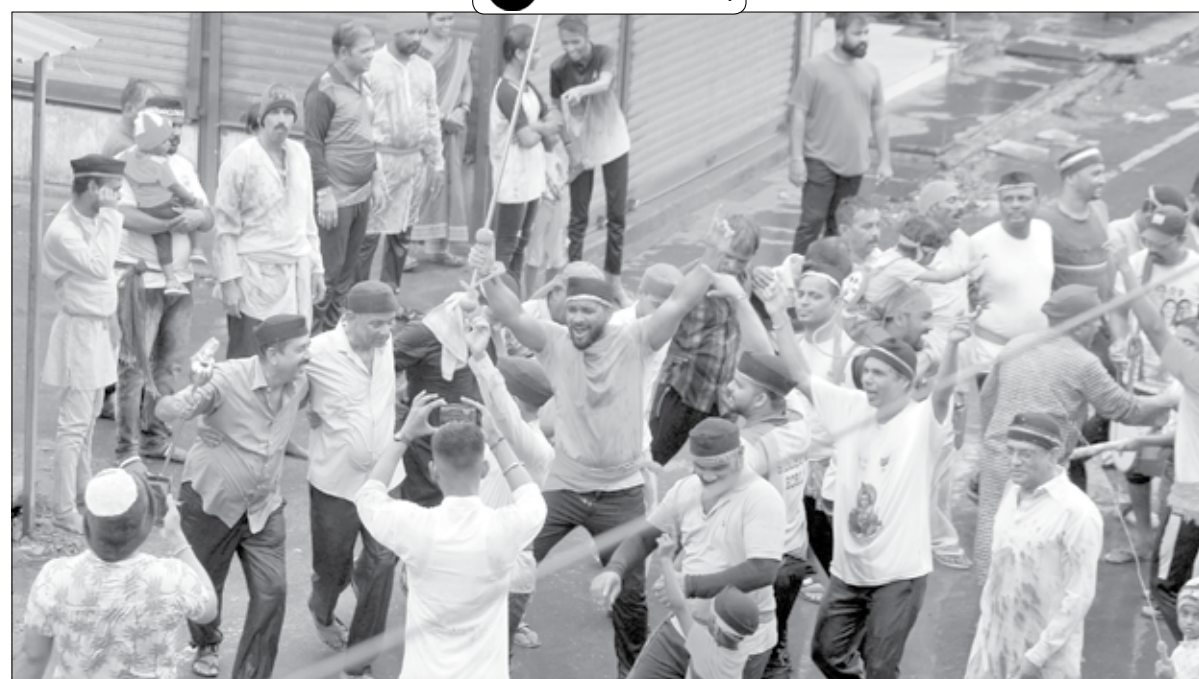
श्रीवर्धन : बोली पंचतन येथे गोपाळकाल्यावेळी गोविंदा पथकांनी जल्लोष करत हा सण साजरा केला.

ज्यांचे तिकीट वेटिंगवर असेल आणि त्यांना पैसे कापले जावेत असे वाटत नसेल तर तसेही केले जाणार आहे. ज्यांना वेटिंग तिकीट नकोय त्यांचे पैसे कापले जाणार नाही. ट्रांजेक्शन फेल झाले तरीही बँकेतून पैसे कापले जाणार नाहीत. ते पैसे दोन तासांसाठी ब्लॉक केले जातील आणि पुन्हा टाकले जातील.