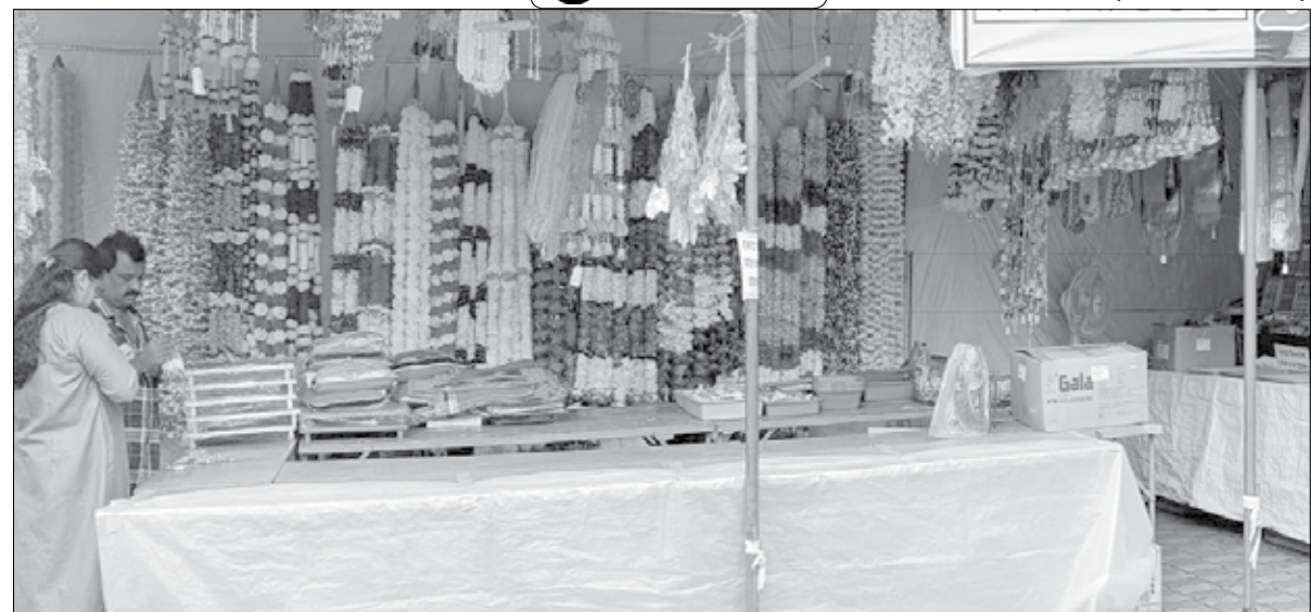
माणगार : दोन दिवसांवर आलेल्या गणेशोत्सवाचे वेध लागले असून शहरात विविध साहित्याची दुकाने सजलेली दिसत आहेत.