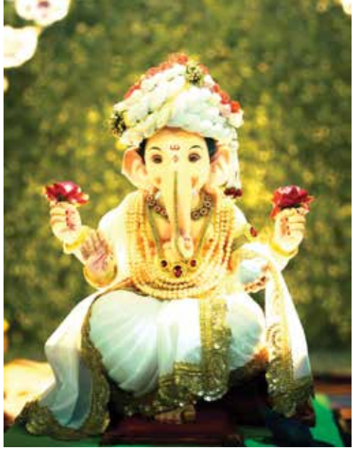
विलास कृष्णा ठाकूर, केळवणे