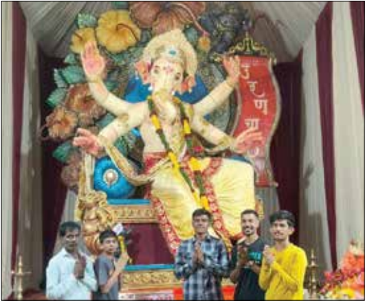
राजे शिवाजी मित्र मंडळ, बुरुड आळी, उरण कोट नाका