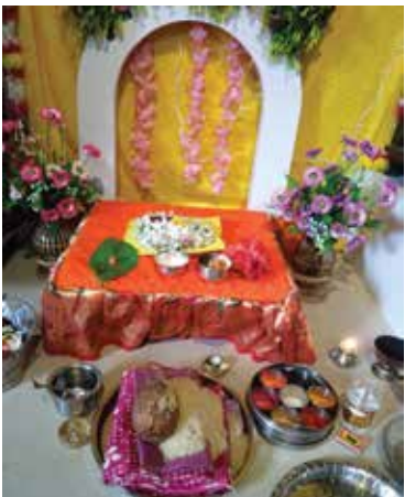
महाड : येथील वैद्य परिवाराची खड्यांची गौराई.