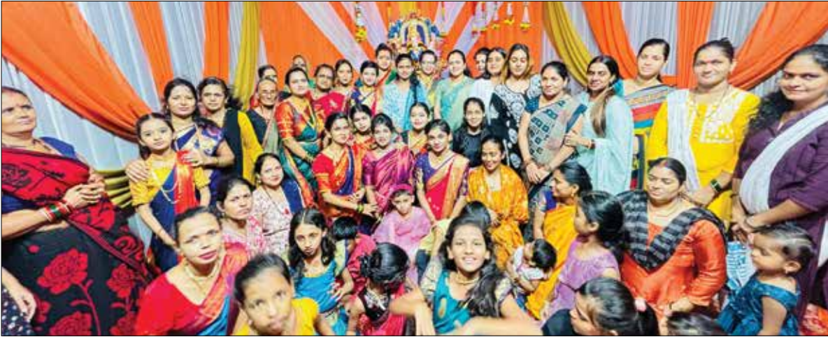
पनवेल : कानपोली येथील बालाजी रेसिडेन्सी बिल्डिंगमध्ये मंगळगौर कार्यक्रमाचे आयोजन करण्यात आले होते.