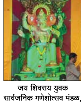
जय शिवराय युवक सार्वजनिक गणेशोत्सव मंडळ, कामठा, उरण