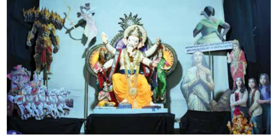
अलिबाग : आदर्श मित्र मंडळाचा गणराज आणि स्त्री अत्याचारांसंदर्भातील देखावा.

राहुल गांधी देशातील प्रत्येक वर्गाला त्यांचे हक्क मिळवण्यापासून रोखू शकत नाही, अशा शब्दांत उपमुख्यमंत्री फडणवीसांनी राहुल गांधींवर निशाणा साधला. राहुल गांधींनी किततीही प्रयत्न केला तरी देशातील प्रत्येक वर्गाला त्यांचे हक्क मिळवण्यापासून रोखू शकत नाही, अशा शब्दांत उपमुख्यमंत्री फडणवीसांनी राहुल गांधींवर निशाणा साधला.