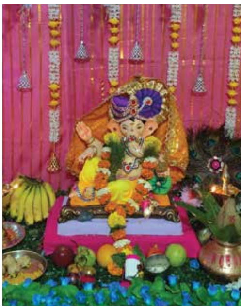
गणेश कदम, करंजाडे