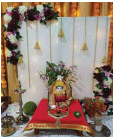
अलिबाग : थळ येथील दाते कुटुंबाची गौराई.