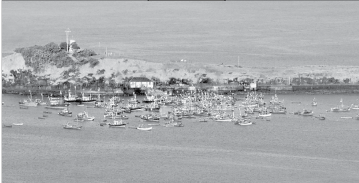
मुरुड : दापोलीजवळील हणें मुरुड येथील कनकदुर्गावरील दीपगृह पर्यटकांना नेहमी आकर्षित करते.