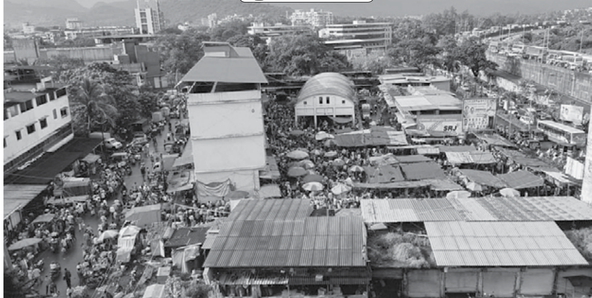
पेण : गणेशोत्सवाच्या पार्श्वभूमीवर कृषी उत्पन्न बाजार समितीमध्ये भाज्या खरेदीसाठी नागरिकांनी गर्दी केली होती.