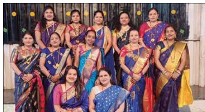
महाराष्ट्र राज्य विद्युत मंडळ वसाहत महिला मंडळ, चेंबूर