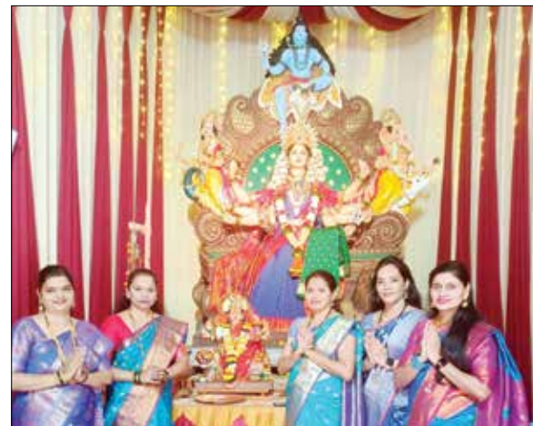
एकता मित्र मंडळ, सेक्टर ३४, कामोटे येथील महिला.