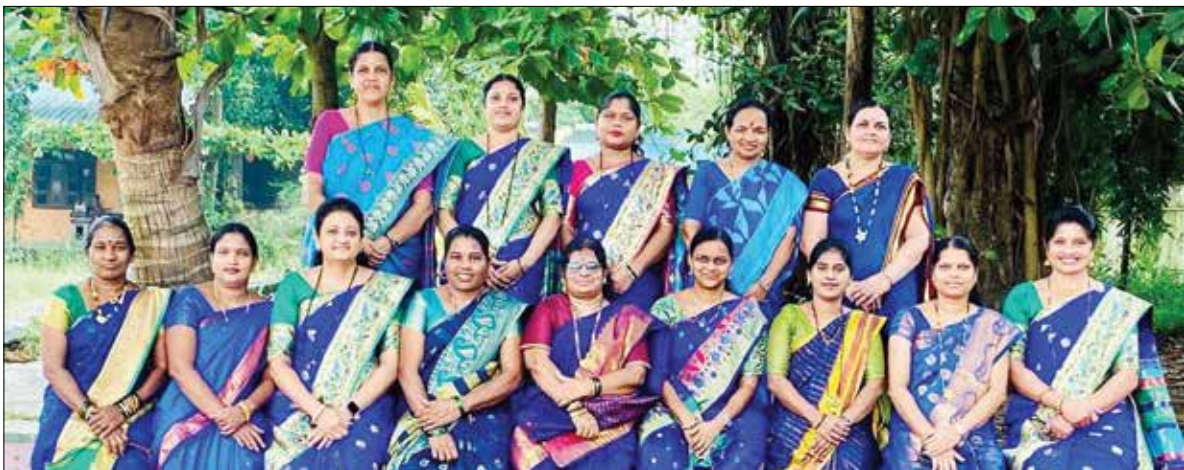
रयत सेविका तु. ह.वाजेकर विद्यालय फुंडे, उरण.