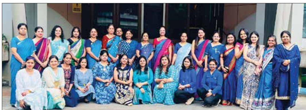
महाराष्ट्र राज्य विद्युत पारेषण कंपनी, (महापारेषण) सांघिक कार्यालय, वांद्रे, मुंबई