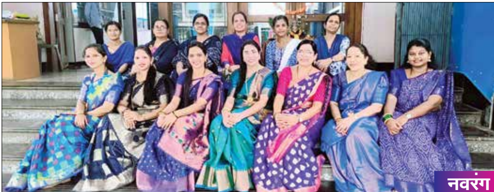
ग्रंथालय विभाग, चांगू काना ठाकूर विद्यालय, पनवेल