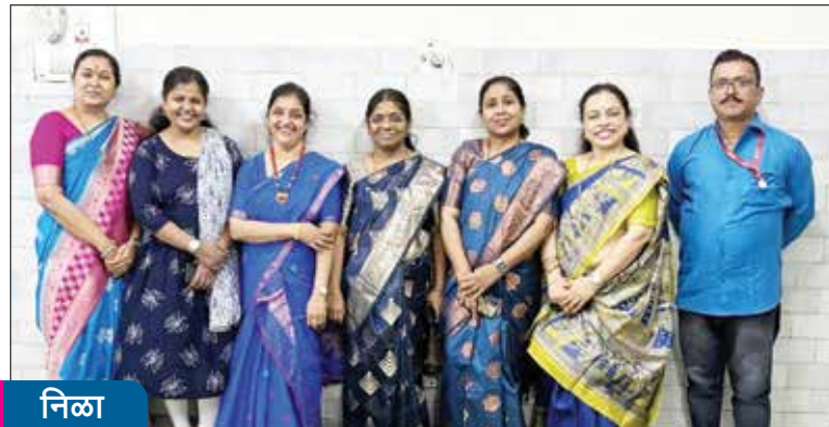
ओएनजीसी हेल्थ सेंटर, पनवेल.