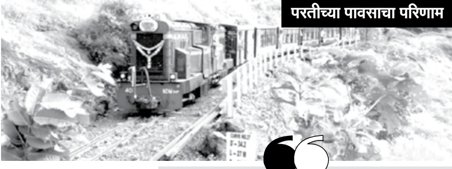
परतीच्या पावसाचा परिणाम

मुंबई, पुण्यातील पर्यटकांना सर्वात जवळचे, निसर्गाने नटलेले सुंदर असे थंड हवेचे ठिकाण म्हणजे माथेरान-नेरळ-माथेरान-नेरळ दरम्यान नॅरोगेजवर धावणारी मिनीट्रेन ही