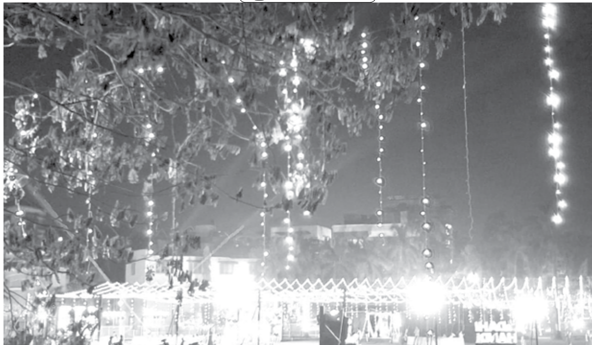
पनवेल : दीपावलीनिमित्त मिडलक्लास हौसिंग सोसायटीचा परिसर रात्रीच्या वेळी रोषणाईने उजळून निघतो.