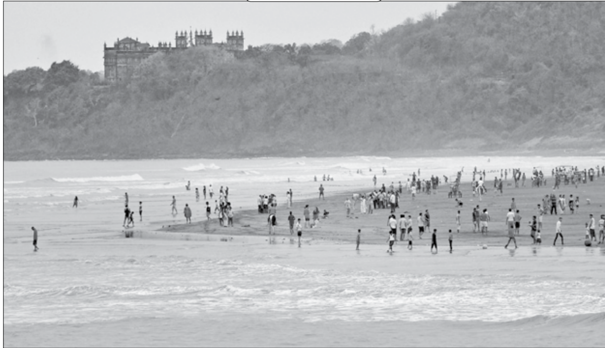
मुरुड : सलग सुट्टीमुळे समुद्रकिनारी पुन्हा पर्यटक दिसू लागले आहेत. कडक उन्हातही लाटांचा आनंद घेत आहेत.