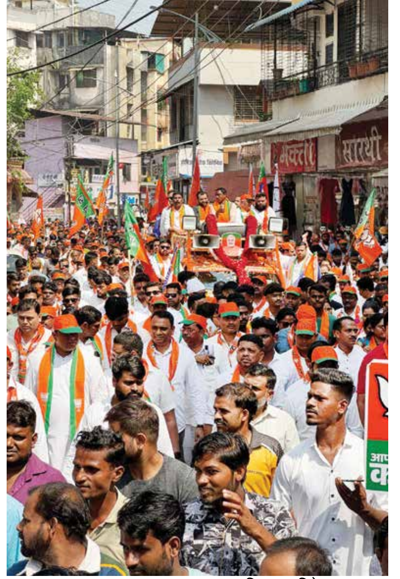
(अधिक छायाचित्रे पान ८ वर..)

या वेळी महायुतीतील नेते, पदाधिकारी, कार्यकर्ते आणि सर्व समाज बांधवांचा जल्लोषात सहभाग होता. विशेष म्हणजे शक्तिप्रदर्शन हा विषयच नव्हता, मात्र हजार कार्यकर्त्यांनी प्रेमापोटी स्वयंस्फूर्तीने सहभाग घेऊन आपला जल्लोष ढोलताशाच्या गजरात दाखवून दिला आणि त्याचे रूप शक्तिप्रदर्शनात झाले होते.