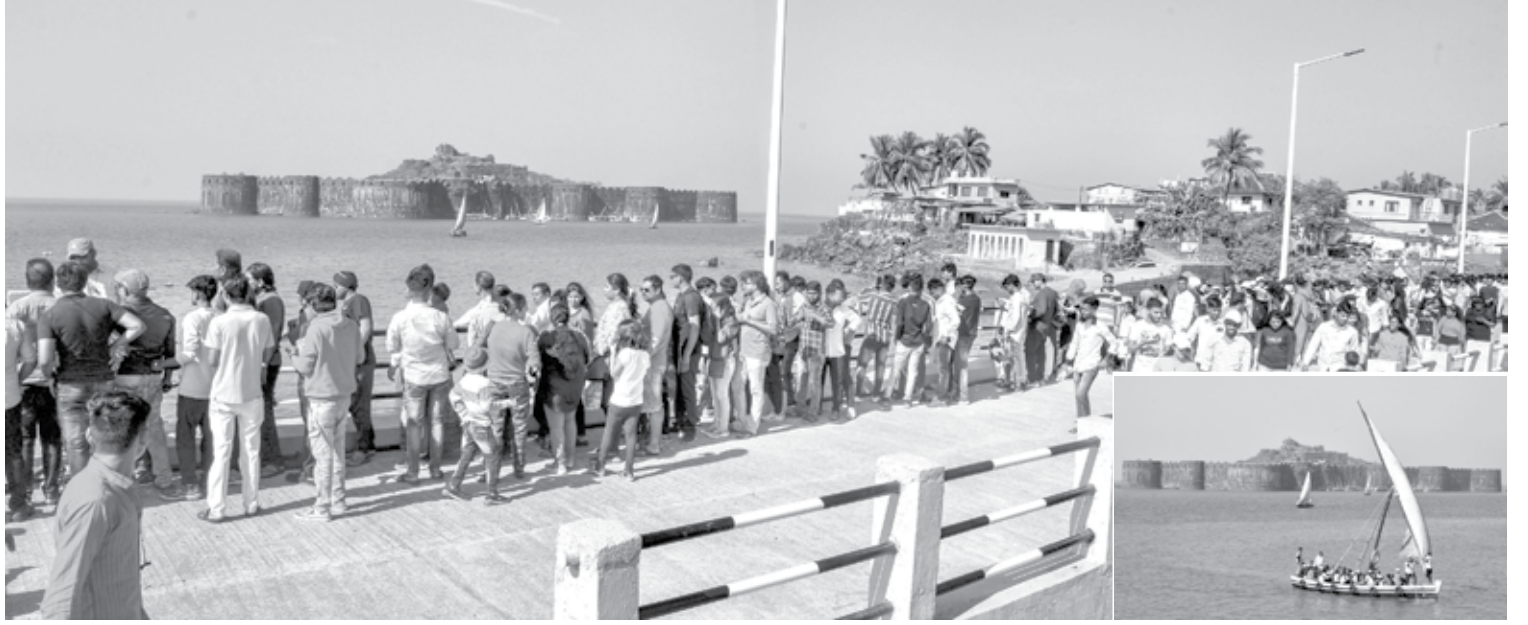
मुरुड : हिवाळी पर्यटन हंगाम सुरू झाल्याने दिवाळीनंतर मोठ्या संख्येने पर्यटक मुरुडमध्ये दाखल होत आहेत. येथील प्रसिद्ध जंजिरा किल्ला पाहण्यासाठी पर्यटकांच्या रांगा लागत आहेत.