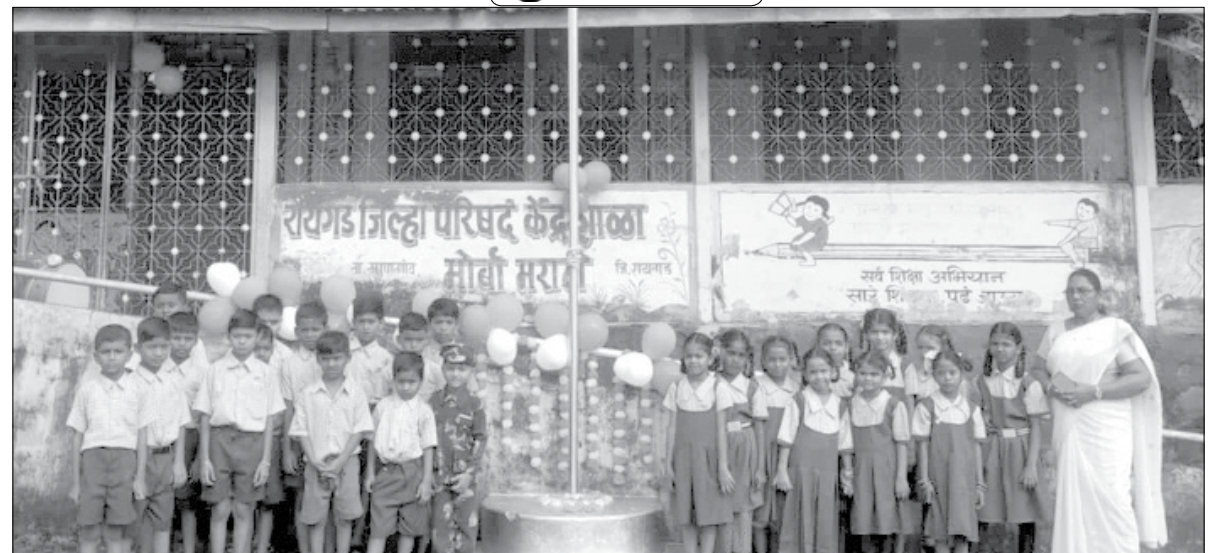
माणगाव : जि.प. केंद्रशाळा मोर्बा येथे बाल दिन उत्साहात साजरा झाला.