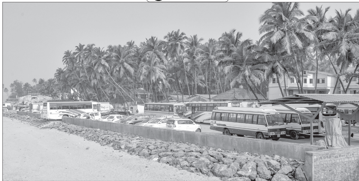
मुरुड : गाड्या पार्किंग करण्यासाठी समुद्र किनारी व्यवस्था झाल्याने पर्यटकांची चिंता मिटली आहे.